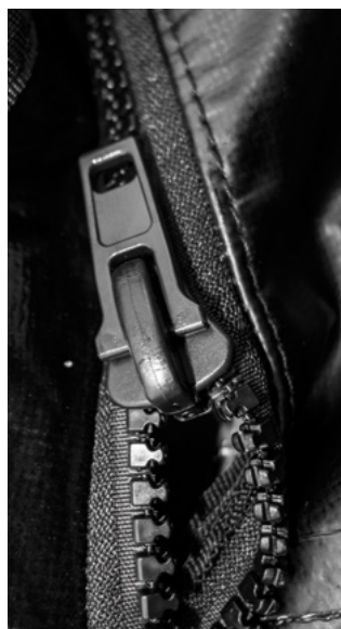
La cremallera es YKK de 8 pitch de plástico.

La nueva Gorilla Pro no es la bolsa más grande del mercado, pero sus medidas están muy cerca de las medidas habituales. Sin embargo, su sistema de cierre la hace muy