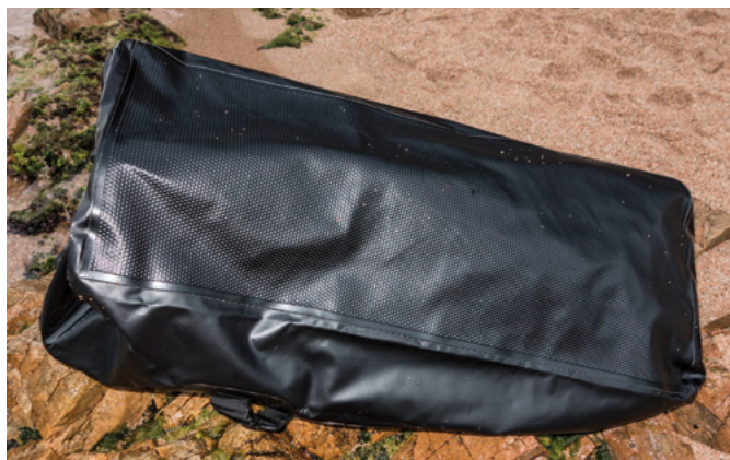
Base con lámina de refuerzo termosoldada, para evitar perforaciones por contacto con puntos incisivos en el suelo.

MARCA Cressi-sub MODELO Gorilla Pro MATERIAL Nylon impermeabilizado con PVC DIMENSIONES 90x35x32 cm CAPACIDAD 115 litros COLOR Negro CORREAS 2 ASAS 2 antideslizantes OTROS Tapón de vaciado roscado y fijo. Tapa superior en forma de U. PRECIO APROX. xxx€