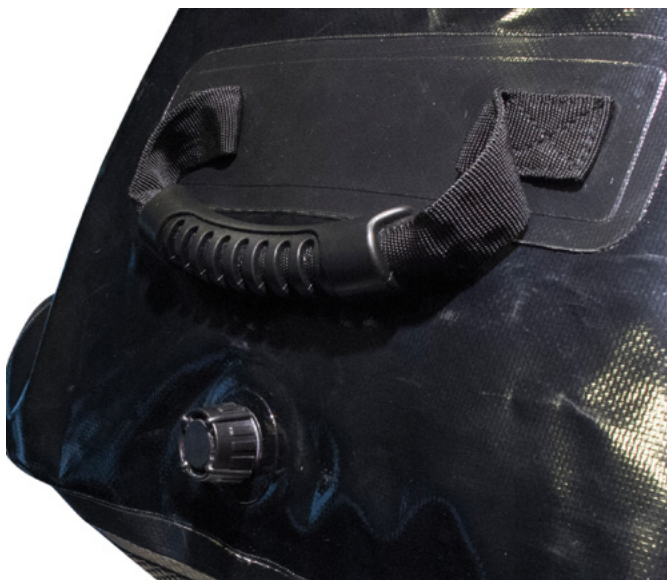
En cada extremo encontramos unas fuertes asas de transporte.